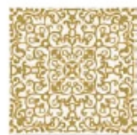
CARMEN Bianco Extra