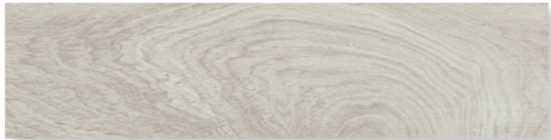
Bois Greige RETTIFICATO 19x79