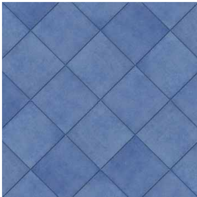
KK26CA 26x26 - 10 1/4" x 10 1/4" Isole Capri