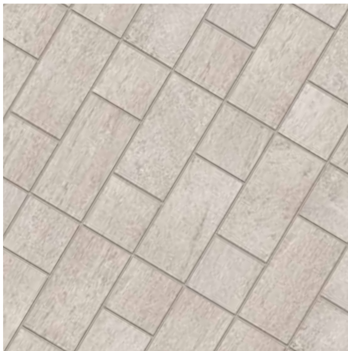
KK41ATA 20x40,6 - 8"x16" Deserti Atacama KK20ATA 20x20 - 8"x8" Deserti Atacama