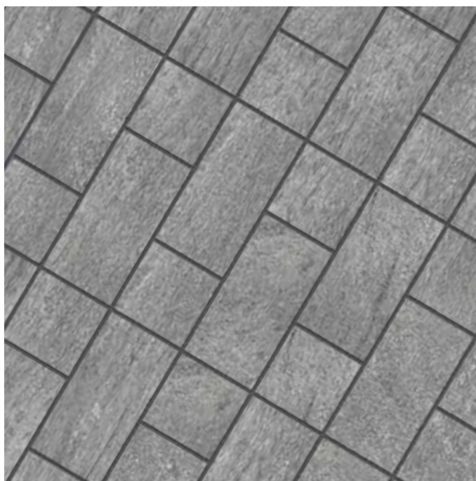
KK41GOB 20x40,6 - 8"x16" Deserti Gobi KK20GOB 20x20 - 8"x8" Deserti Gobi