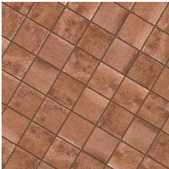
KK41SAH 20x40,6 - 8"x16" Deserti Sahara KK20SAH 20x20 - 8"x8" Deserti Sahara