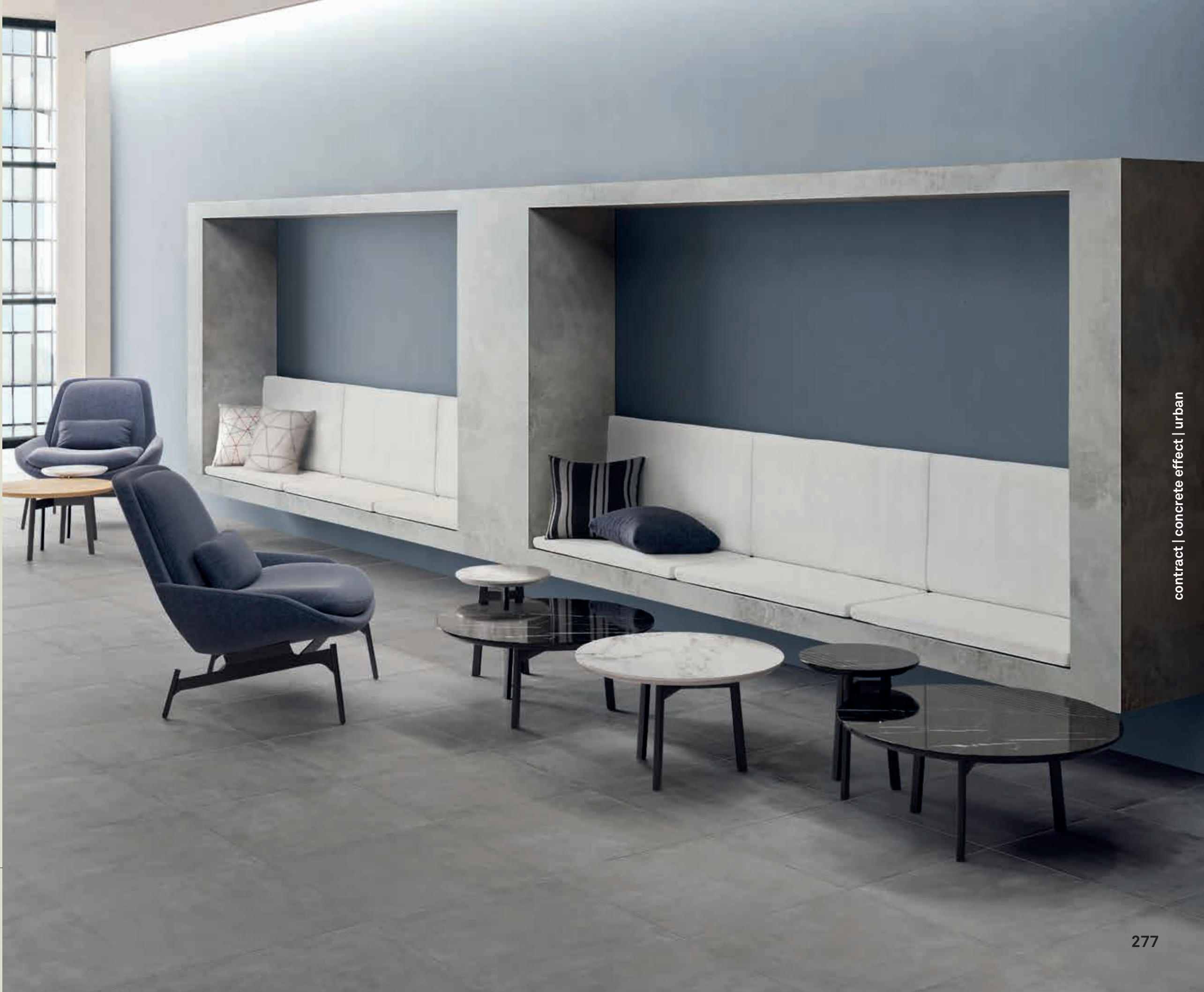
URBAN GREY 60x60 (24"x24")