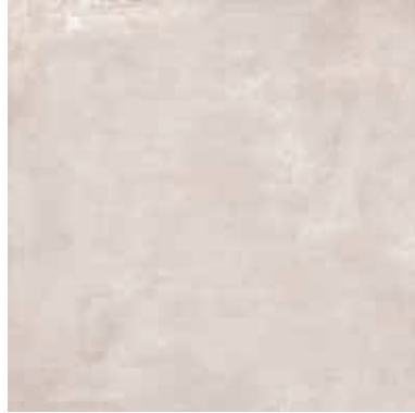
URBAN IVORY V2