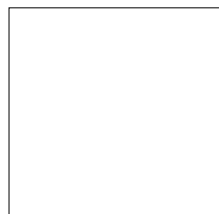
90X90 CM Rett. 35"X35" Rect.