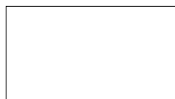
60X120 CM Rett. 24"X48" Rect.