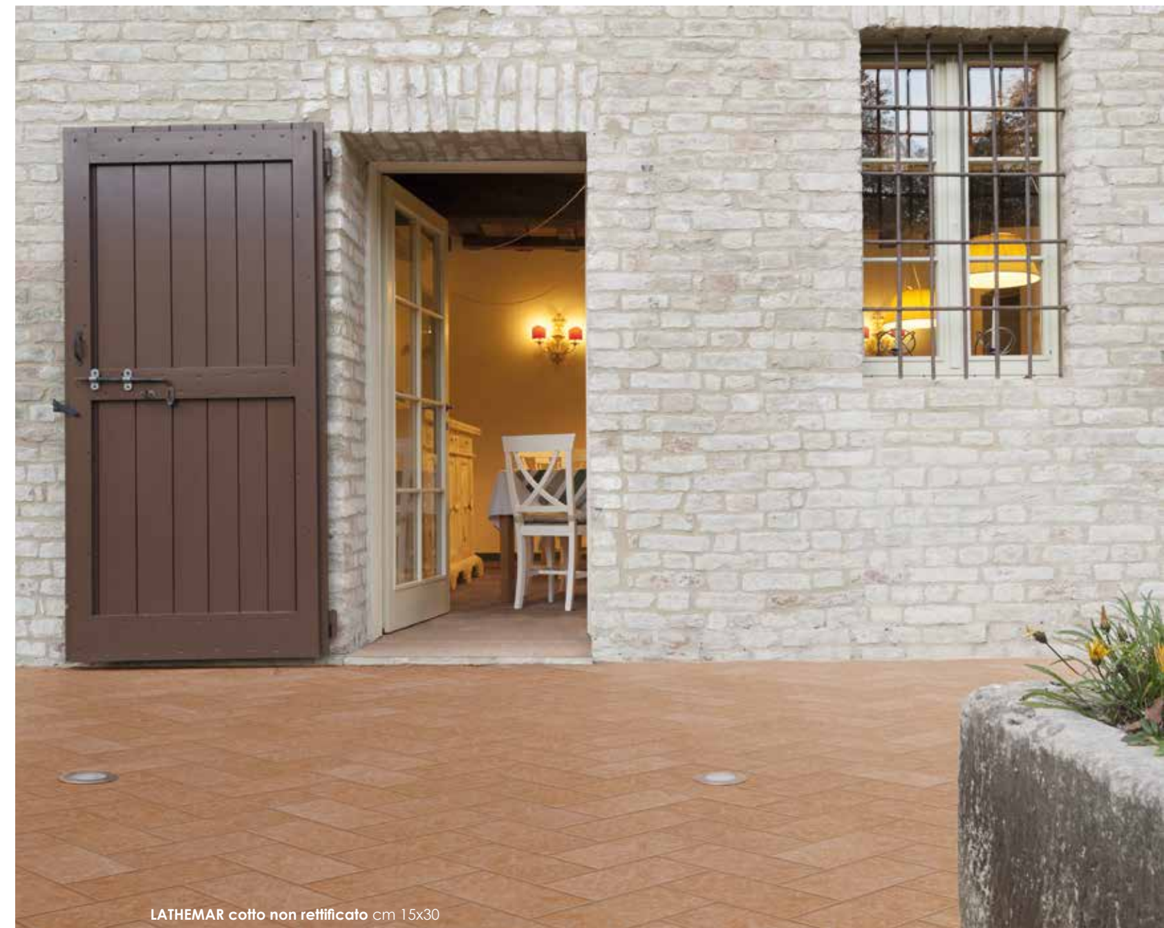
LATHEMAR cotto non rettificato cm 15x30

* È sempre consigliabile posare i formati 30x30 e/o 15x15 all'interno dell'elemento a "L" con una posa in diagonale It is always advisable to lay 30x30 size tiles and/or 15x15 size tiles crosswise within the "L" element Il est toujours conseillé de poser les formats 30x30 et/ou 15x15 à l'intérieur de l'élément en "L" avec une pose en diagonale Das verlegen der formate 30x30 und/oder 15x15 sollte stets im innern des l-förmigen elements erfolgen. Dabei diagonal vorgehen