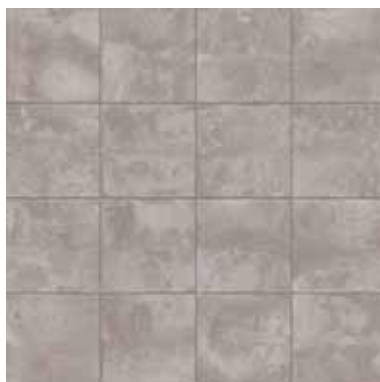
KK26MCE Cemento 26x26 - 10¼" x 10¼"