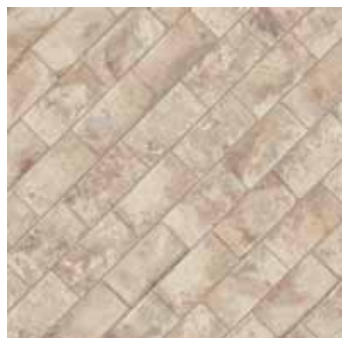
KK13MAR Argilla 13x26 - 5½" x 10¼"

KK26MAR Argilla 26x26 - 10¼" x 10¼" KK13MAR Argilla 13x26 - 5½" x 10¼"