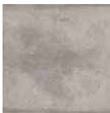
KK26MCE Cemento 26x26 - 10 1/4" x 10 1/4"