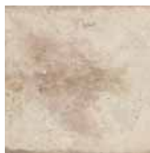
KK26MAR Argilla 26x26 - 10 1/4" x 10 1/4"