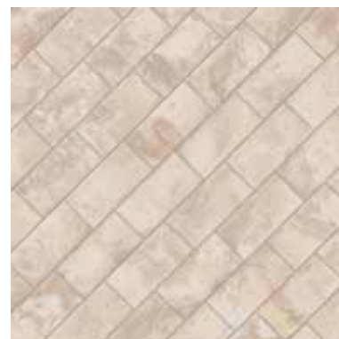
KK13MSA Sabbia 13x26 - 5½" x 10¼"