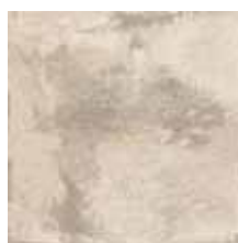
KK26MSA Sabbia 26x26 - 10 1/4" x 10 1/4"