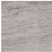
KK30,6CBAG Barge Grigio 30,6x30,6 - 12"x12"