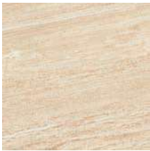
KK30,6CBAR Barge 30,6x30,6 - 12"x12"