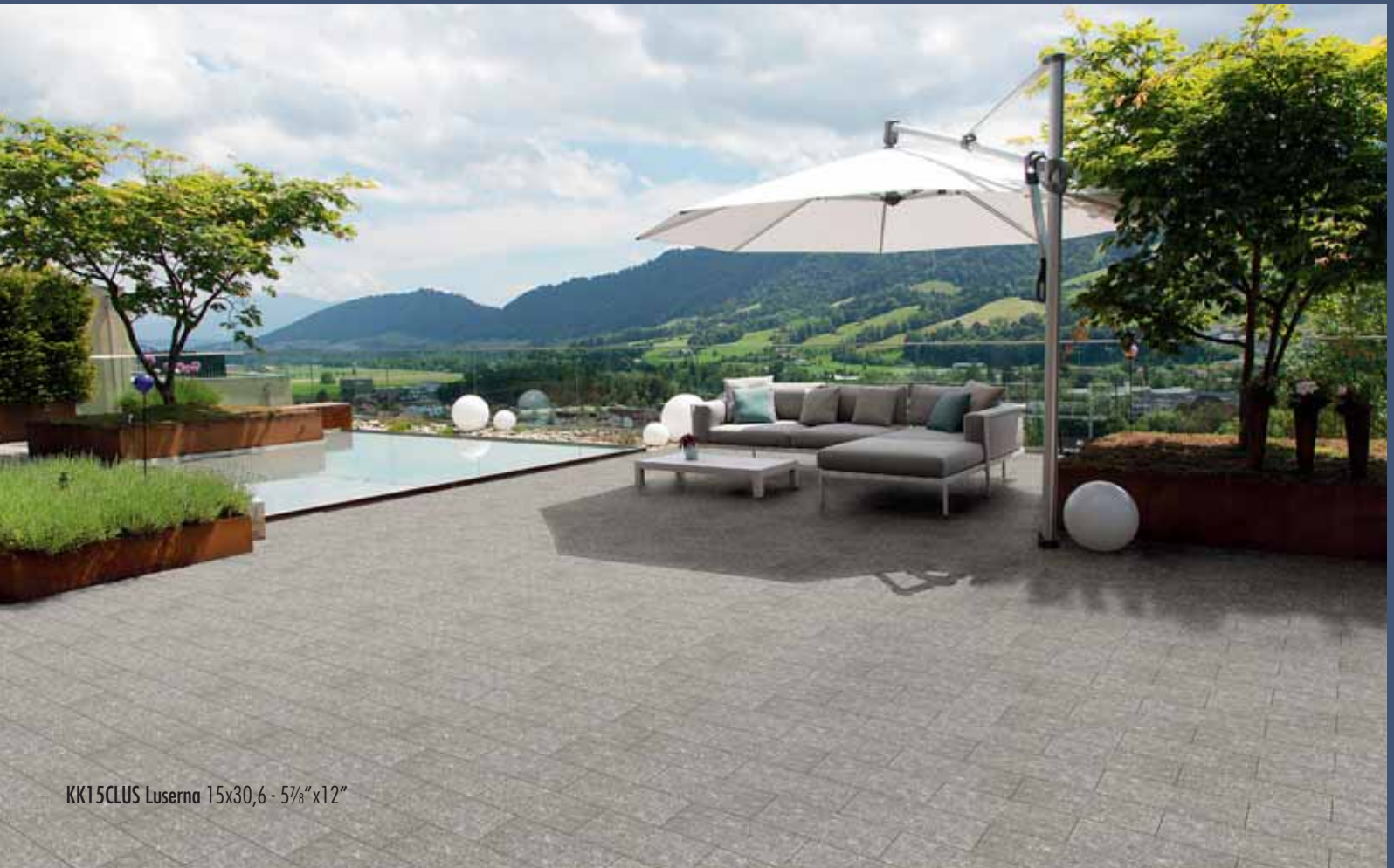
KK15CLUS Luserna 15x30,6 - 5 7 / 8 "x12"