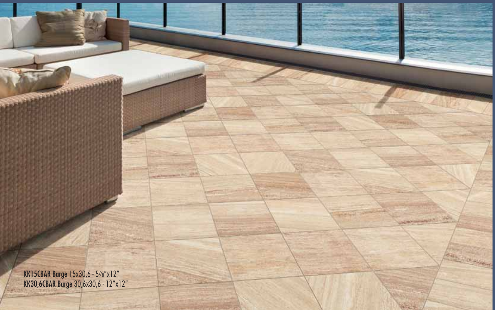
KK15CBAR Barge 15x30,6 - 5 7 / 8 "x12" KK30,6CBAR Barge 30,6x30,6 - 12"x12"