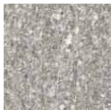
KK30,6CLUS LUSERNA 30,6x30,6 - 12" x 12"