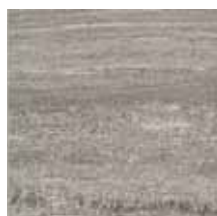
KK30,6CBAG Barge Grigio 30,6x30,6 - 12" x 12"