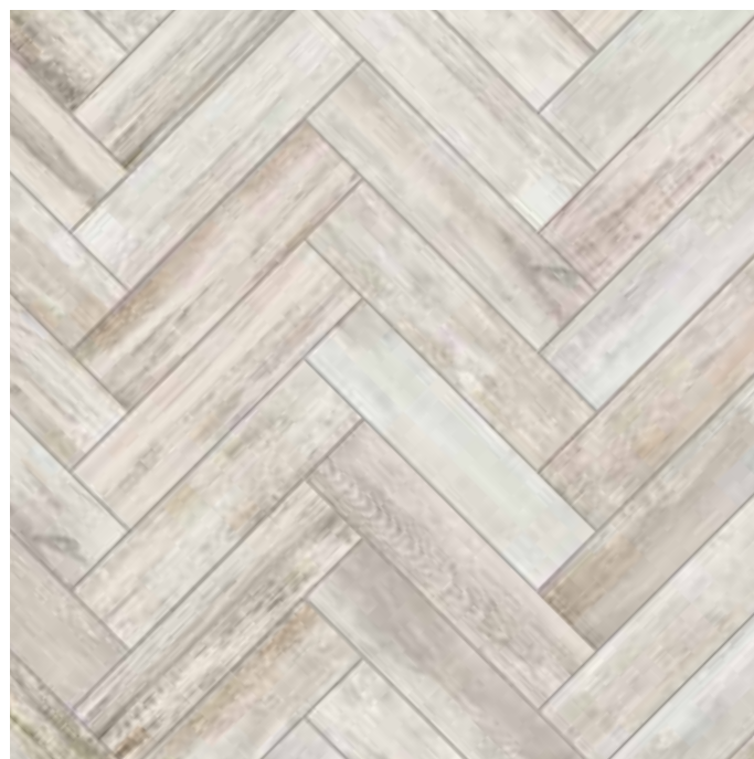
KK10AMS Abitare Maso 10x40 - 4" x16"