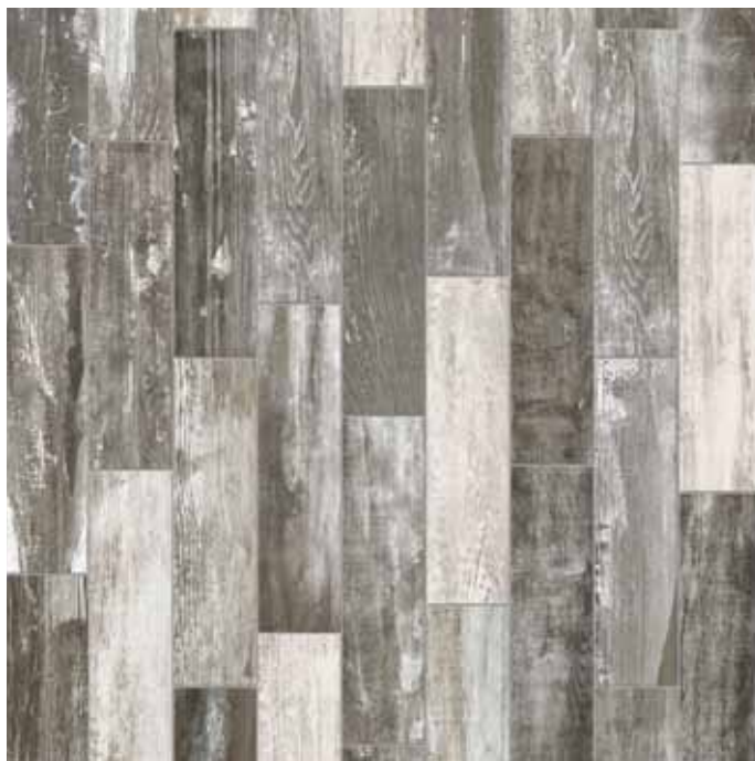
KK10ABT Abitare Baita 10x40 - 4" x16"