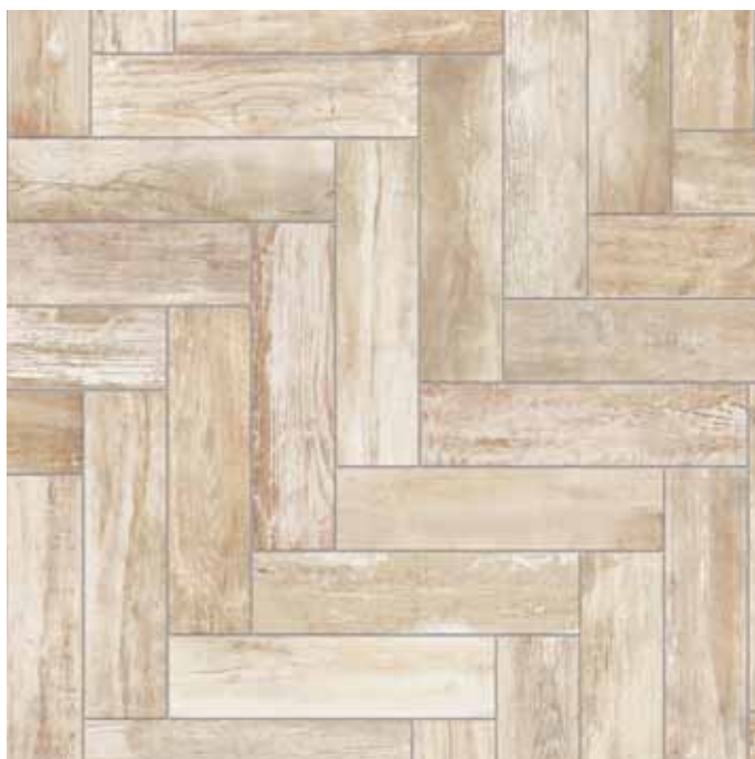
KK10AML Abitare Malga 10x40 - 4" x16"