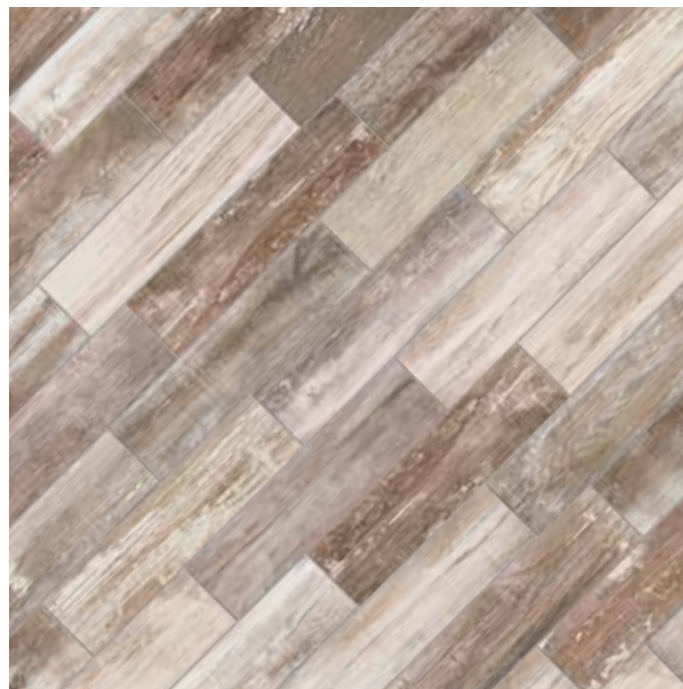
KK10ACH Abitare Chalet 10x40 - 4" x16"