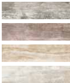
KK10ABT Baita KK10ACH Chalet KK10AML Malga KK10AMS Maso 10x40 - 4"x16"