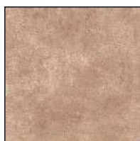
KK26GR/C Cotto 26x26 - 10¼"x10¼"