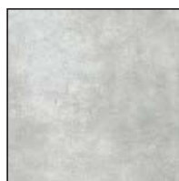
KK26GR/T Tortora 26x26 - 10¼"x10¼"