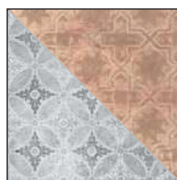
KK26GR/DM Decori Misti KK26GR/DC Cotto Decori Misti 26x26 - 10¼"x10¼"