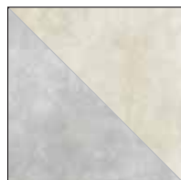
KK26GR/A Avorio KK26GR/T Tortora 26x26 - 10¼"x10¼"