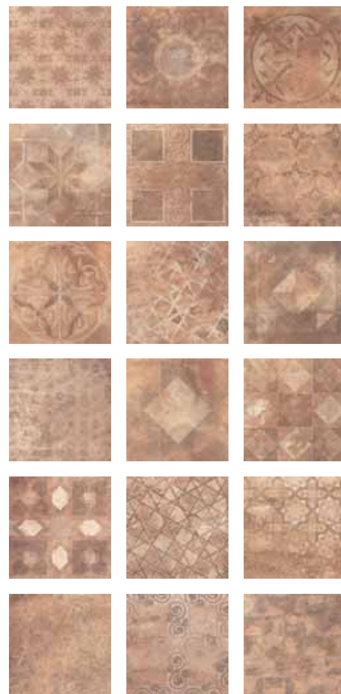
KK26GR/DC Cotto Decori Misti (18 decori differenti già miscelati nella scatola) 18 decorated tiles mixed in the box 26x26 - 10¼"x10¼"