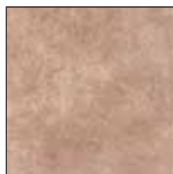
KK26GR/C Cotto 26x26 - 10¼"x10¼"