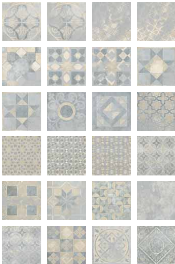
KK26GR/DM Decori Misti (24 decori differenti già miscelati nella scatola) 24 decorated tiles mixed in the box 26x26 - 10¼"x10¼"