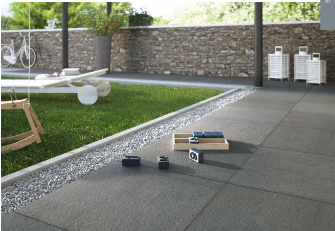
gres 20.0: TP49008 Pietra Basaltina Bocciardata 60x60 23% 6 ”x23% 6 ”