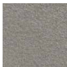
TP45293 Bocciardata 60x60 23 \frac{5}{8} "x23 \frac{5}{8} " Rettificato