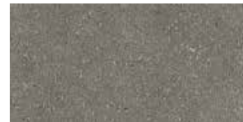
TP45289 Naturale 30x60 11 5 / 8 "x23 5 / 8 " Rettificato