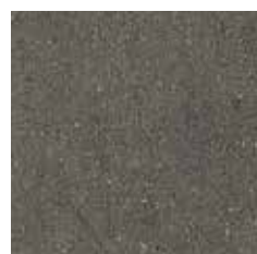
TP45295 Levigata lucida 60x60 23 \frac{5}{8} "x23 \frac{5}{8} " Rettificato