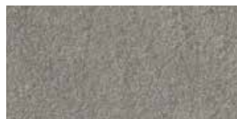
TP45294 Bocciardata 45x90 17 \frac{5}{8} "x35 \frac{5}{8} " Rettificato