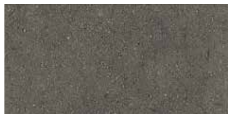
TP49191 Levigata lucida 60x120 23 \frac{5}{8} "x47 \frac{5}{8} " Rettificato